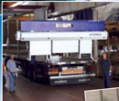
IEMCA'S shipping department IEMCA Versandabteilung