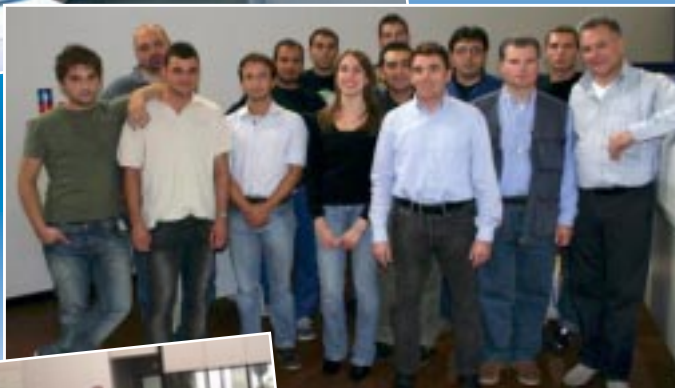
The IEMCA technical service team IEMCA Team für technischen Kundendienst (Zentrale)