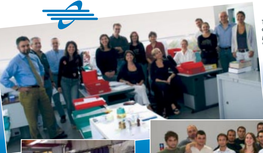
The sales department at IEMCA IEMCA Vertriebsabteilung